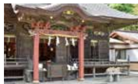
大洗磯前神社 古くから家内安全、海上交通の守神として信仰を集めてきました。