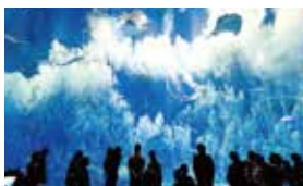
アクアワールド・茨城県大洗水族館 約580種、68,000点の生物を展示。なかでもサメの飼育展示数は日本一なんです!