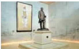
幕末と明治の博物館 静かな松林の中に行む博物館。水戸藩ゆかりの品々を展示しています。