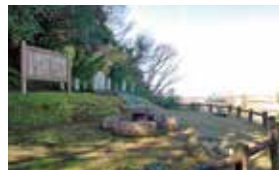
巖船夕照 (水戸八景) 徳川斉昭が選出した「水戸八景」のひとつ。特に美しく見える夕景が人気です。