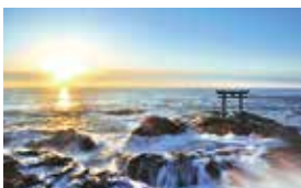
神磯の鳥居 特に日の出が美しく、幅広い年代に人気のパワースポット。記念撮影にも◎