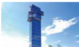
大洗マリンタワー 高さ約55mの展望台からは、太平洋の一大パノラマを堪能できます。