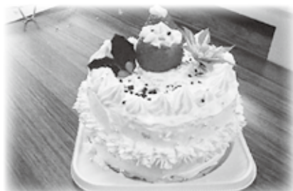
クリスマスケーキづくり