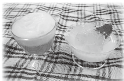
夏のゼリーづくり