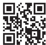
インターネット予約

予約・問合せ 新型コロナワクチン相談電話(健康増進課内) ☎ 229-3393 (平日8:30～17:15)