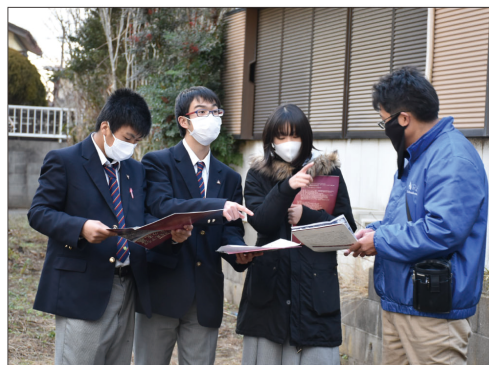
②県立大洗高等学校の授業