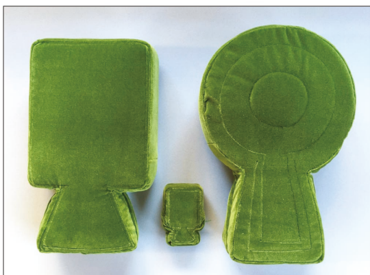
⑨古墳クッションの製作