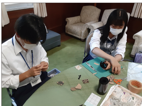
⑤町高校生会による考古学企画展の準備