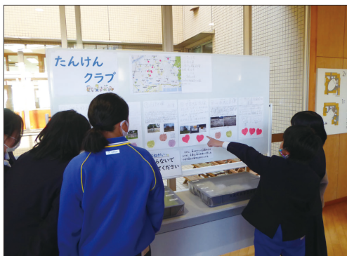
①町立大洗小学校のクラブ活動