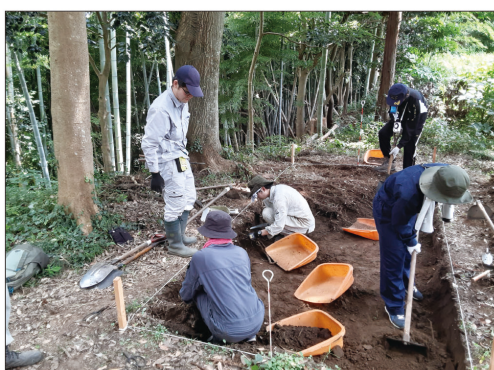
③茨城大学学生による調査