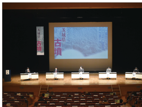
⑧シンポジウム『茨城県の古墳』