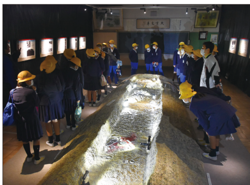
⑦考古学企画展『常陸鏡塚』