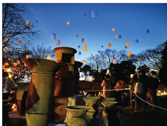
⑫イベント『うみまち照らす in 磯浜古墳群』