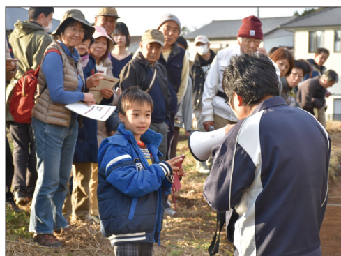
⑥磯浜古墳群の史跡探訪