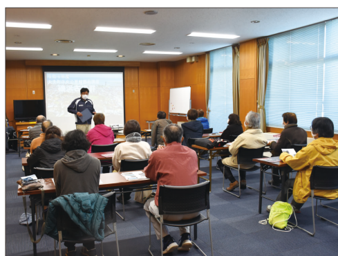
④町中央公民館の歴史講座