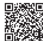
茨城県計量検定所