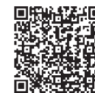
インボイス制度特設サイト

※インボイス制度についての詳細は、国税庁ホームページの「インボイス制度特設サイト」をご覧ください。