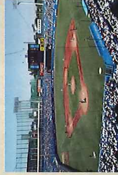
2022年5月 早慶戦(明治神宮野球場)

日本における野球熱の原点は早慶戦である。1903(明治36)年に早稲田大学野球部が義塾野球部宛に挑戦状を送達し、三田綱町グラウンドにて早慶第1回戦が開催された。結果は11-9で慶應義塾の勝利。以後早慶戦は、学生野球の頂点を決める戦いとして日本全国から注目を浴びる。しかし、早慶戦における学生たちの応援のあまりの過熱ぶりから暴