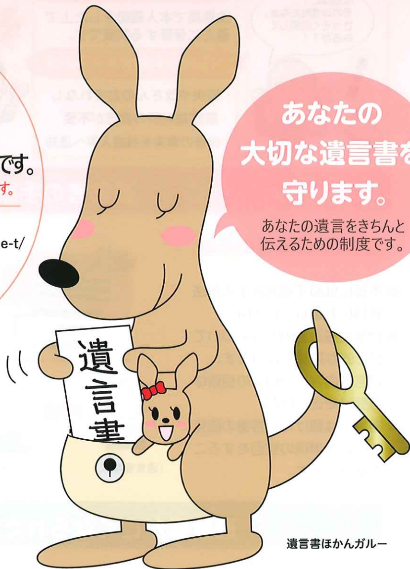
遺言書ほかんガルー