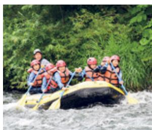
北海道洋上体験学習