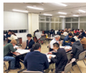
大洗町国際交流協会 日本語教室