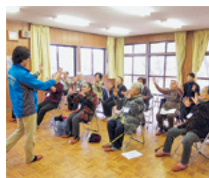
元気づくりサロン