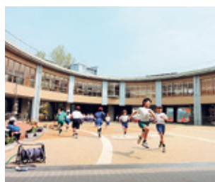
大洗小学校 いそはまプラザ

いつの時代も主役は一人ひとりの住民です。 住民の思いや痛みなどに寄り添い、「不幸」を無くすことによって、 大洗に生まれ、育ち、学び、働き、そして住んで、 心から良かったと思える暮らし満足度No.1のまちを目指します。