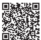
LINE 友達登録のQRコード