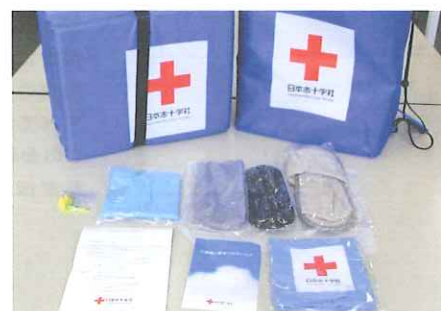
▲避難所生活に必要な救援物資(マット等)