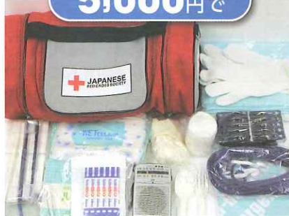
緊急セット 1セット4人分