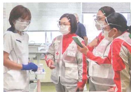
▲医療支援を行う日赤職員