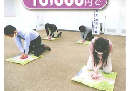
心肺蘇生トレーニングキット 6人分

資金の有効活用のため、この受領証をもって日本赤十字社の受領証にかえさせていただきます。 なお、本受領証は、免税証として利用いただけます。