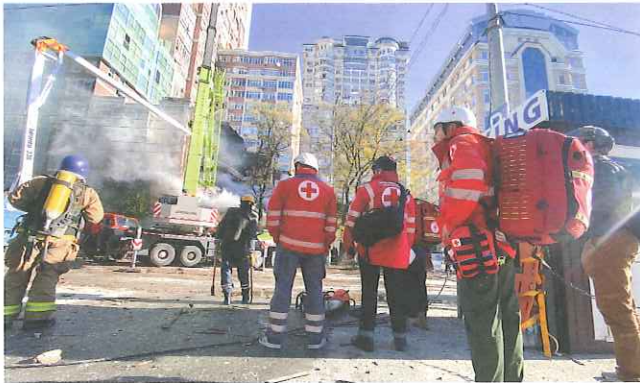
▲首都キーウで攻撃のなか、24時間体制で対応する緊急対応チーム

日本赤十字社は、資金援助に加え、ウクライナや周辺国に職員を派遣し、現地のニーズに対応した支援活動を展開しています。