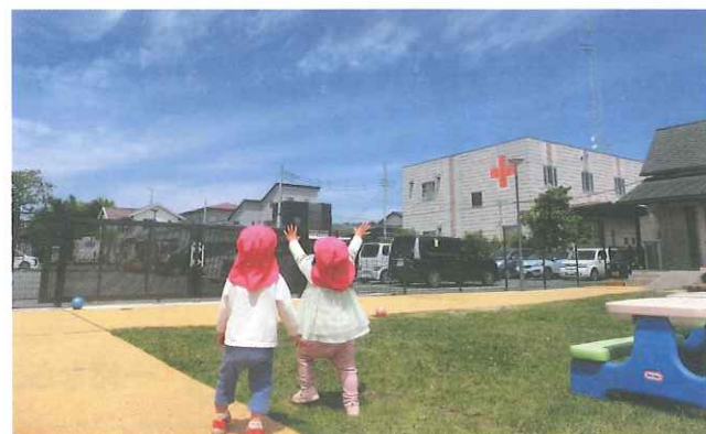
▲しゃぼん玉を追いかける乳幼児

また、乳児院では、子どもたちと一緒に遊び、授乳や離乳食を介助するボランティアが活躍しています。