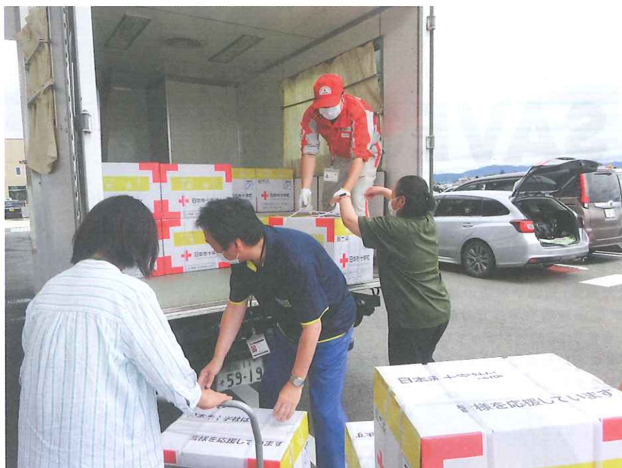
▲【令和4年8月大雨災害】救援物資を被災地に届ける日赤職員