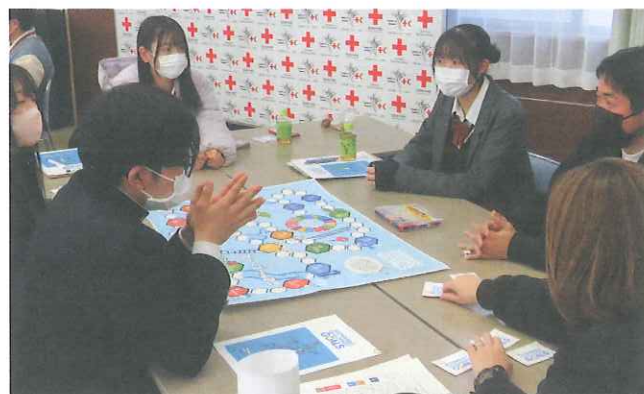
▲SDGsについて学ぶ高校生メンバー

本県では、350校、約66,000人のメンバーが、校外での清掃活動、慰問、募金活動等の活動を通して、赤十字の心を育んでいます。