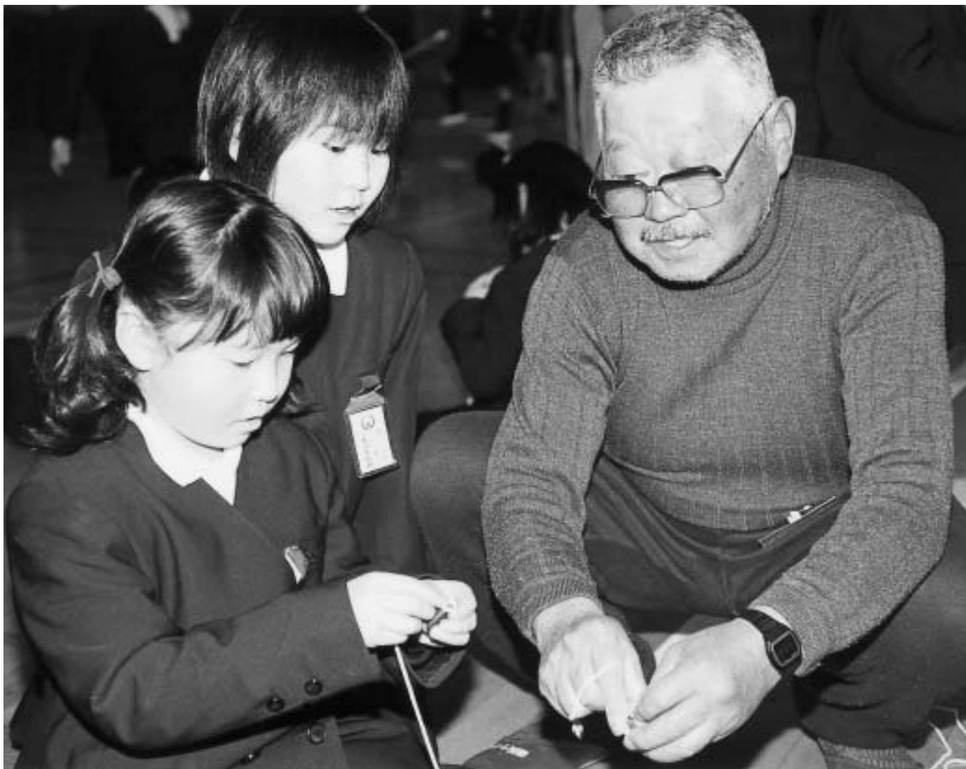
昔の遊びって新鮮！（磯浜小学校児童と高年者クラブの交流会）