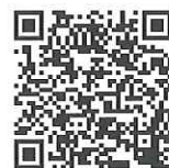
◀感染予防学習 坂東市立猿島中学校