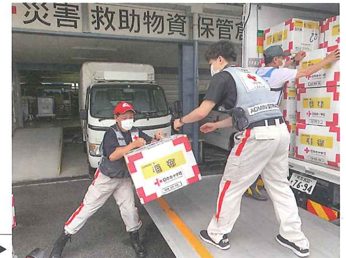
ボランティアの協力で迅速に被災地へ ▶

日本赤十字社では、医療救護活動に加え、避難所生活を余儀なくされた被災者の方々に、こころと体を温めるための「毛布」、感染予防に役立つマスクやウエットティッシュなどを収納した「緊急セット」など、様々な救援物資をお届けしました。