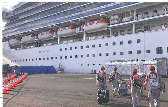
クルーズ船内の救護に向かう医療チーム ▶

厚生労働省からの派遣依頼に基づき、この双方に医療チームを派遣し、延べ255名の赤十字職員が、多くの方々の健康確保に努めました。