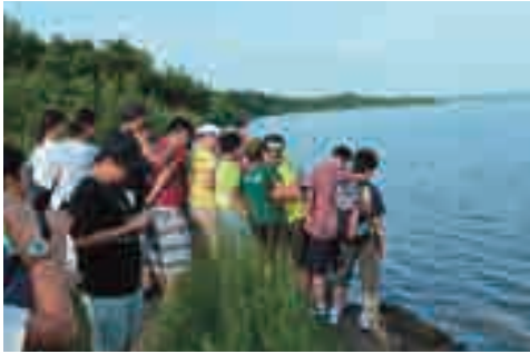
ウトナイ湖でのひととき♪♪

ている班もありました。実際に動物に触れることができるところもあり、嬉しそうなお子ども達の表情が忘れられませぬ。最後に洞沼湖と同じくラムサール条約認定のウトナイ湖で集合写真を撮り、フェリー乗船前に一息ついてから、大洗への帰路に着きました。