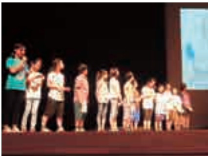
事後研修では一人ずつ舞台の上で発表！