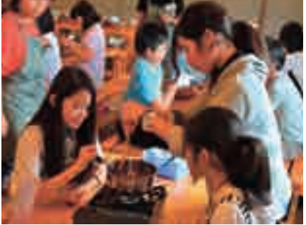
自然体験学習 ジャム&アイス作り、木工・羊毛クラフト