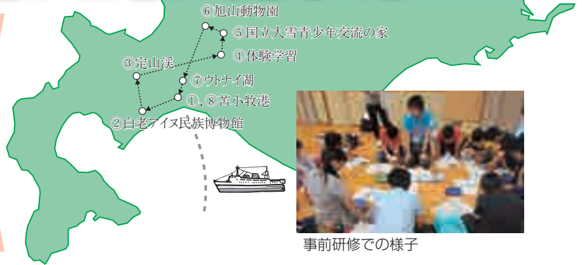
事前研修での様子

洋上体験学習では、食事や清掃、自然体験学習などを通して、協力心や責任感がうまわれ、また、相手のことを考えながら生活を送ることができるようになるなど、豊かな心の育成を目的としています。 2回にわたる事前研修(7月5日・20日)では、他校の児童と活動するための関係づくりや協力心を育て、また、一人ひとつずつ係を担当することで、自分の役割に責任をもって取り組む、心構えをもたせます。