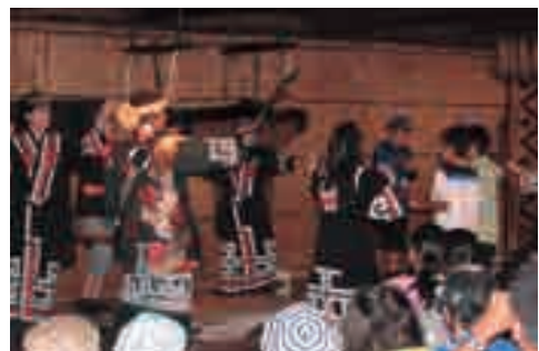
アイヌ民族について様々な事を学びました！

7月27日(月)、旭山動物園では、前日までの雨模様が嘘のように晴れ、各班とも計画していた順路で、動物との触れ合いや見学を行いました。中には入場者が多く計画を変えながら、臨機応変に対応し