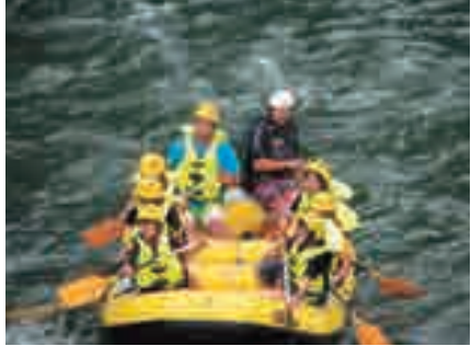
自然体験学習 ラフティング