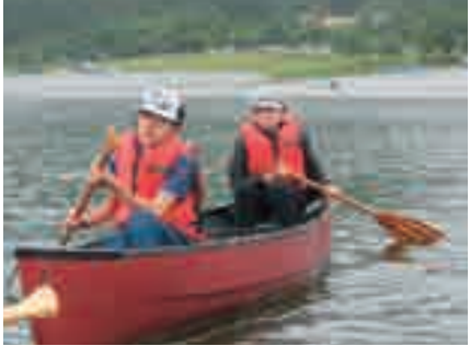
自然体験学習 カナディアンカヌー