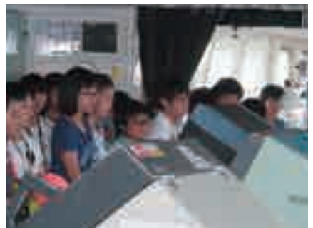
フェリーのブリッジ見学