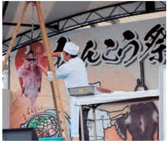
あんこう吊るし切り実演