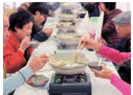
あんこう亭であんこう鍋を堪能

11月15日(日)に冬の味覚「あんこう」を堪能するイベント「大洗あんこう祭」が大洗マリントワー前広場で開催され、前日から降り続く雨にも関わらず、9時のイベント開始宣言から多くの方々で賑わいました。 18kg級あんこうの吊し切り実演、「あんこう亭」での60食限定本格あんこう鍋や2千食分用意したあんこう汁販売(一部チャリティー)など、目・舌・鼻で大洗のあんこうを堪能していました。 友好都市等観光PRタイムでは、各市町村長がゆるキャラを伴って観光PR行い、物産展では各自治体の名産品が勢揃い。4年連続となるアニメ「ガールズ&パンツァー」のキャストのステージイベントでは動けないほどの来場者が会場を埋め尽くしました。 また、髭金商店街から曲がり松商店街までを歩行者天国にした第2会場では、痛車コンテストが開催され散策する多くの人々で賑わいました。