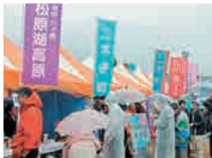
賑わう友好都市等の物産ブース