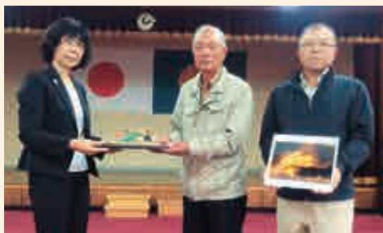
寄贈された大洗町作品