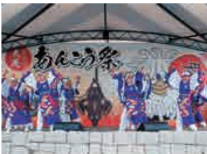
岡山県鏡野町のソーラン鏡野