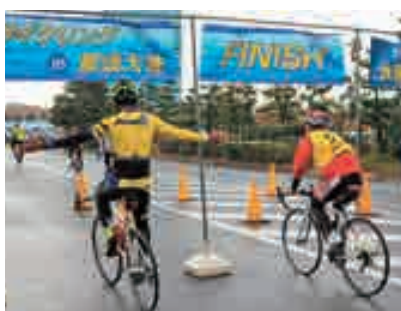
ゴール!! お疲れ様でした

あんこう祭と同日、栃木県那須町から大洗町までを自転車で走るサイクリングイベントが開催されました。今回が初の開催となり、総勢40名が110kmを自転車で駆け抜けました。