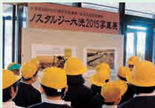
見学した大洗小学校児童

来場された方々が話し込む場面が見られ、「懐かしい風景で、昔を思い出しました。」という声がかかれました。また、大洗小学校の児童も見学し、学校区内の移り変わりを学びました。