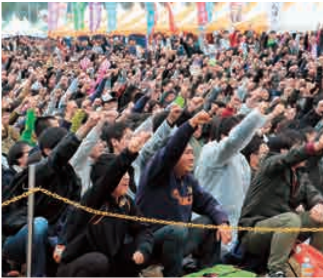
みんなでパンツァー・フォー!