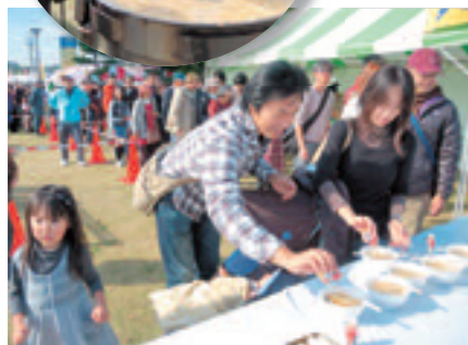
あんこう汁チャリティ配布に長蛇の列