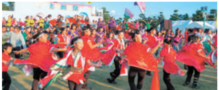
参加チームがいっせいにダンスを披露して会場を盛り上げました