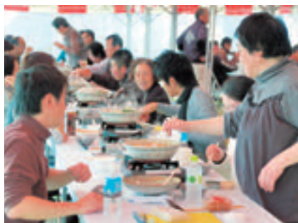
本格あんこう鍋に舌鼓(あんこう亭)