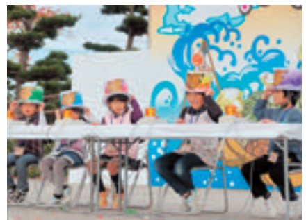
早押しクイズに挑戦