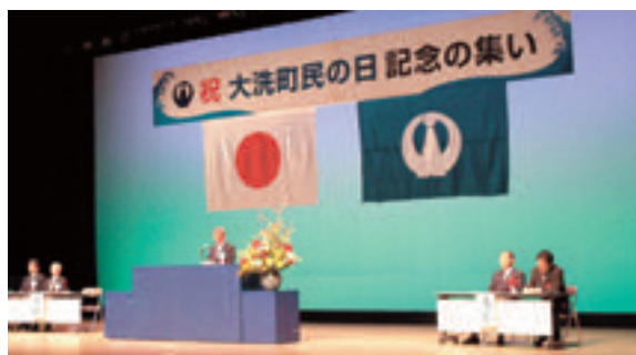
式辞を述べる小谷町長