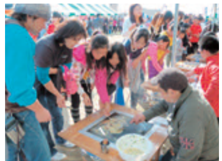
大洗のB級グルメ「たらしコンテスト」