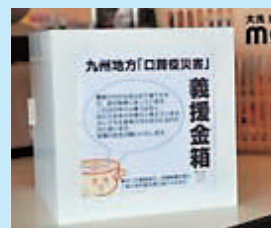
レジカウンターに設置された「募金箱」

募金活動は継続的に続け、毎月末締めで公的機関を通じて被災地に送金する予定とのこと。