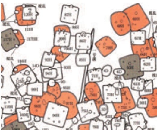
一本松遺跡の住居の重なり方

これだけの数の住居が連綿と作られ、この地で多くの人々が生活を維持できた背景とは、何であったのか。考古学上の大きな謎となっています。塩作りが盛んだったのではないかと、河口という要衝の地を背景とした物資を流通させる拠点集落であったのではないかと、絹織物の生産・流通が盛んであったのではないかと、海から水揚げされる海産資源の加工・生産が盛んであったのではないかなど、幾つもの考えが示されています。しかし、定まった説は、未だに明らかにされていません。今後、駅周辺や一本松・米蔵地遺跡などの発掘調査が進むことで、明らかになる可能性があります。 (町生涯学習課文化振興係)