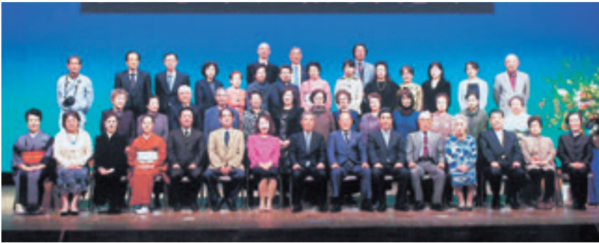
芸術文化祭で表彰された皆さん