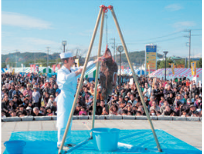
晴天に恵まれ、たくさんの観光客が訪れたあんこう祭

11月20日(土)、21日(日)、冬の味覚「あんこう」を堪能するイベント、「大洗あんこう祭」並びに「大洗舞祭」が、大洗マリンタワー前広場を会場にして盛大に開催されました。