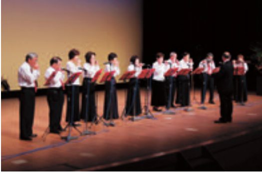
高崎市群馬支部の皆さんのハーモニカ演奏