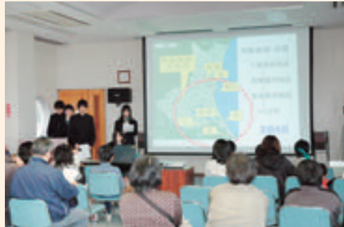
清真学園の科学ツアー発表