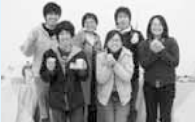
ボランティアの大学生