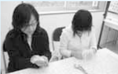
親子で石けんづくり

大洗海の大学には、本校と分校があります。本校で開催する教室は、日程が決まっていて予約制です。分校は、大洗リゾートアウトレットの「海賊の館」にあります。基本的に土曜日と日曜日に開催しています。開催時間は10時30分から15時までで、時間内であればいつでも参加できます。教室の内容は、「海藻エキス入り無添加石けんづくり」や石に絵を描く「ストーンアート」、「海藻押し葉」、「貝がらロウソクづくり」、「絵てがみ」、「ちぎり絵」など浜辺のアートを作成します。大洗町民や大学生の方々の協力を得て教室を運営しています。参加費は、300円です。