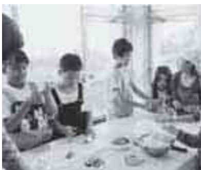
食事の準備や掃除もみんなで力を合わせて行いました。

験をしながら学校へ通いました。長い期間家庭を離れることによって、家庭の大切さを再認識することができたと思います。子ども達は、たくさんの経験を積み、より一層たくましく成長することができました。