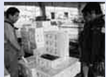
地域に出かけ地域に学ぶ総合的な学習