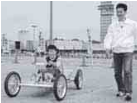
水素燃料電池車を体験