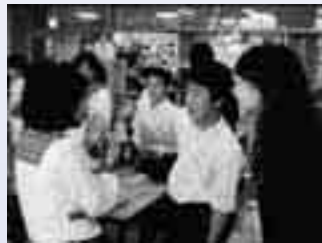
コミュニケーション能力を育てる英語学習