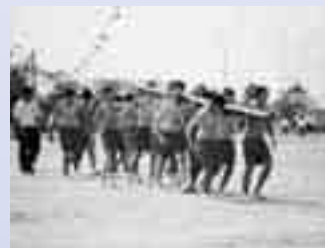
伝統的な大運動会