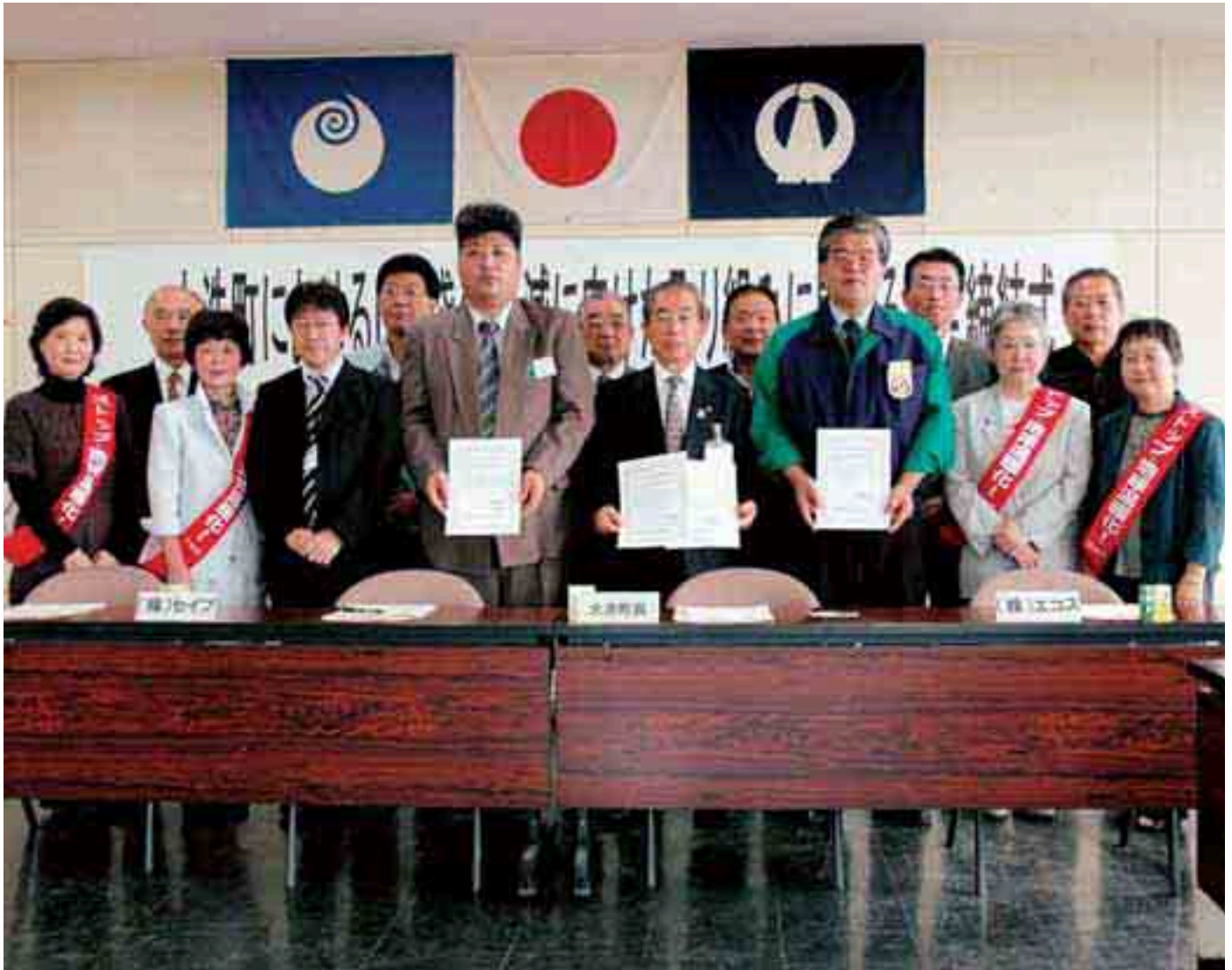
レジ袋削減を目指す協定を締結しました(関連P2)