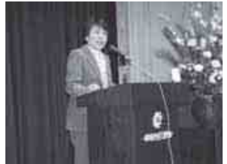
神津カンナ氏の講演会

10月18日・25日の2日間、大洗わくわく科学館をメイン会場にして、第2回茨城原子力体験フェアが開催されました。18日は、作家の神津カンナ氏の特別講演会が開かれ、「思慮深いまなざしを育むために」と題して日本のエネルギーと原子力についてのお話に、会場に訪れた約200名の皆さんは熱心に聞き入りました。 また、25日には、原子力事業所の出店や公開ラジオ収録、原子力ウルトラライズ、科学工作教室など様々な催しのほか、大洗港第4埠頭イベントバスでは、町催事として、水素自動車の体験試乗やミニFCV工作教室、子供向けの水素燃料電池車試乗体験などが行われ、大勢の家族連れで賑わいを見せました。