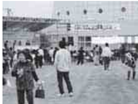
賑わうわくわく科学館イベント会場