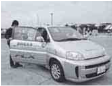
次世代の車、水素自動車の体験試乗