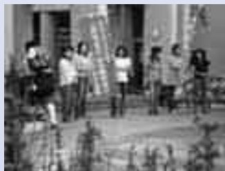
保護者によるあいさつ運動

保護者の方によるあいさつ運動・地域の方との様々な文化交流、全力を出し切り、地域とともに燃える大運動会、生徒が自ら地域にでかけ、これからの大洗町を考えている総合的な学習の時間など、常に地域とともにある南中学校です。2年間コミュニティ・スクールの推進事業の委嘱を受け、さらに地域と進化する学校づくりをめざしていきます。