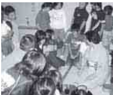
茶道やスナッグゴルフを体験しました。