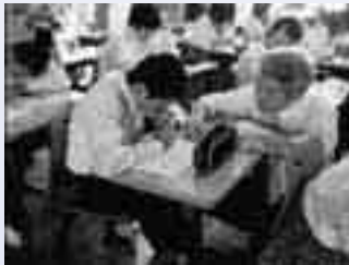
一人一人にきめ細やかな指導を

生徒も教師も互いに学び合う 進化する授業づくりを 平成19・20年度文部科学省委嘱「伝え合う力を養う調査研究事業」