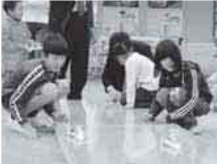
作成したミニFCVを走らせる子どもたち