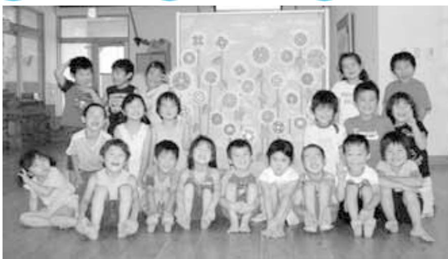
「折り紙で、ひまわりの制作をしました。」 上手に出来ました!