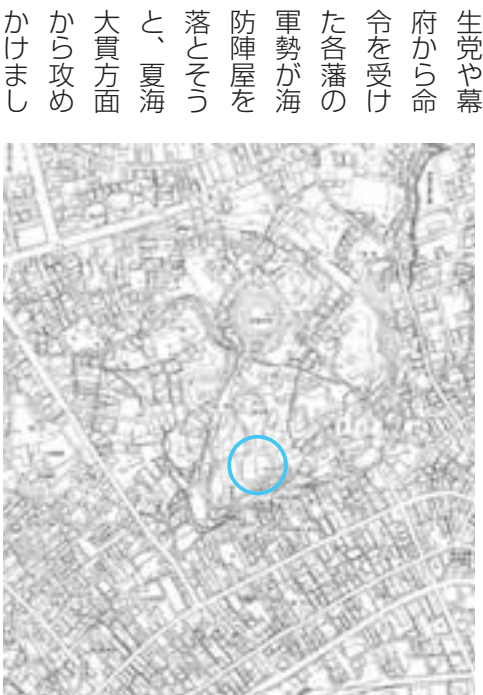
磯浜海防陣屋の位置