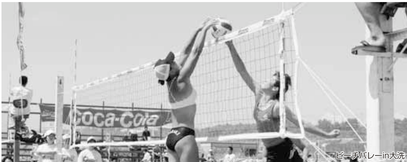
ビーチバレーin大洗