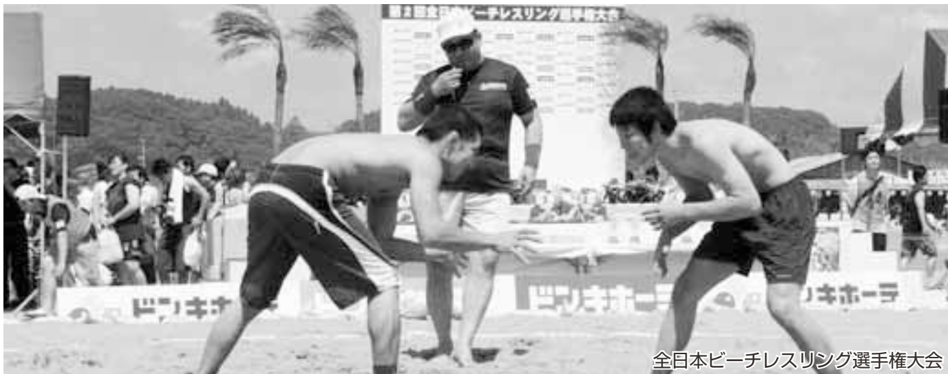
全日本ビーチテニス選手権大会