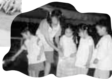
うわあ~きれい!!! わたしのはなびにもつけて!