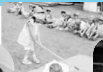
ここかな? えーい!!! あー、おいしい! もう 少しで当たったね。