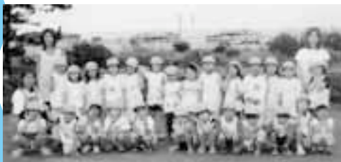
みんなでおさんぽ 海の前で全員集合 ハイチーズ!