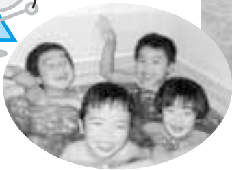
みんなでおふる いいゆだなあ~