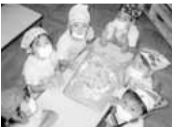
きょうのクッキングは じざつくり。おいしそつ に出来たでしょー!