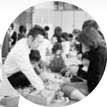
第二保育所 親子七夕製作