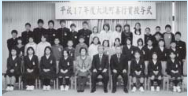
善行賞を受賞したみなさん

3月1日（水）各校長から推薦された町内の小・中学生39人に、大洗町善行賞が授与されました。「ごみ袋を持参して自宅近くの公園や駐車場のごみ拾いを継続して実施している」「道案内や人助けをした」など、日頃から心がけている行いや、思わず行動にあらわれた優しい心に対し、毎年贈られています。今回は家族ぐるみでの善行が多く見られ、みんなの模範となっています。