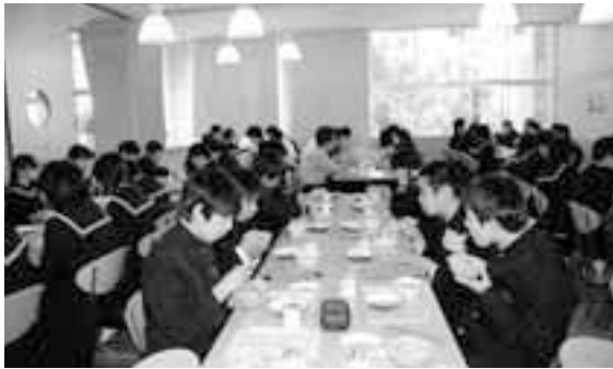
大洗第一中学校ランチルーム

ホッキ貝は大洗町漁業協同組合の協力を得て、約800個を用意していただきました。その日の給食は、ホッキ貝の他にも米(日の出米)・さつまいも・だいこんが大洗産でした。今後も学校給食は、地元の新鮮な食材を取り入れておいしい給食を提供します。