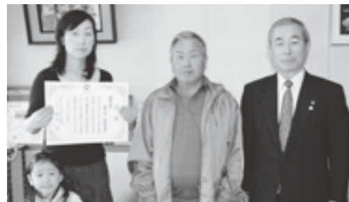
二葉1区・2区町内会