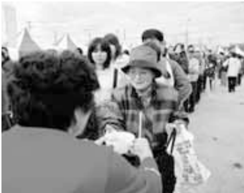
あんこう鍋の無料配布には大行列