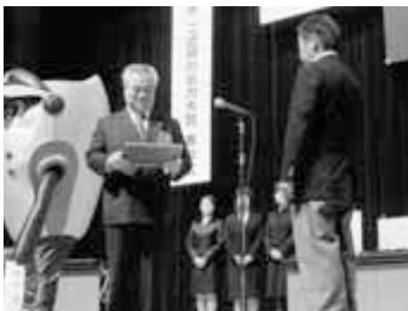
橋本県知事より、表彰プレートが手渡されました。表彰式会場にて(県民文化センター)

10月19日(木)、県民文化センターにおいて大洗海の大学が、いばらきイメージアップ大賞「奨励賞」を受賞しました。 いばらきイメージアップ大賞とは、「元氣ないばらき」のイメージアップとなる県民・企業・行政などの様々な取り組みを表彰し、郷土への誇りの醸成と県のイメージアップを図り、「元氣ないばらきづくり」を推進するものです。 大洗海の大学は「海にまつわる地域資源を活用し、住民総ぐるみで斬新的な体験プログラムを創出。本県を代表する海洋交流の先導者としての活躍に期待する」との評価を受けて、応募件数135件の中から見事「奨励賞」を受賞しました。