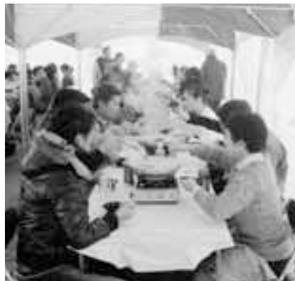
大洗旅館組合の皆さんが実施した「あんこう亭」ではおいしいそんなニオイが漂っていました