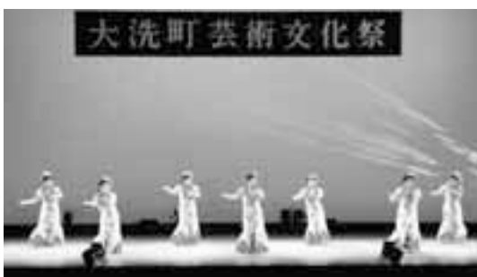
旧群馬町の皆さんによるフラダンス