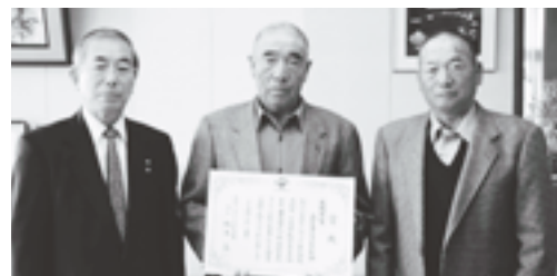
高齢者クラブときわ会