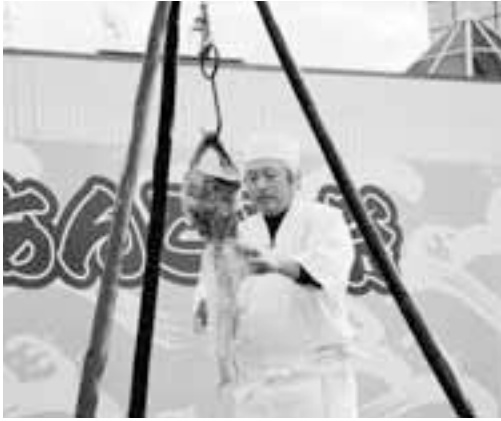
あんこう吊るし切り実演

また、同時に県内40チーム約1,200人が参加した大洗舞祭ダンスコンテストが同時開催され、会場を盛り上げていました。そのほかにも、地元特産品販売や北関東うみ・やま交流フェア、自衛隊PRコーナーなどさまざまな催しが行われ会場は大いに賑わいました。