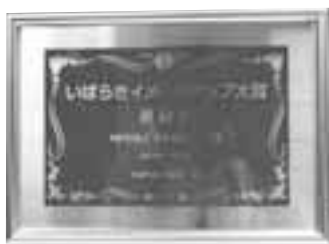
輝かしき表彰プレート

すべてのカリキュラムについて、随時受付を行っております。 電話・FAX・Eメールでお申し込み下さい。 尚、定員になり次第締め切ります。