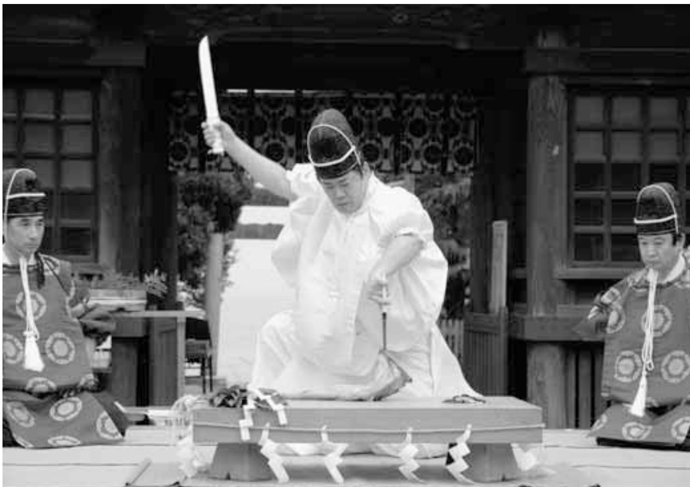
大洗冬の味覚あんこうに感謝して「あんこう奉納庖丁式」(関連P2)