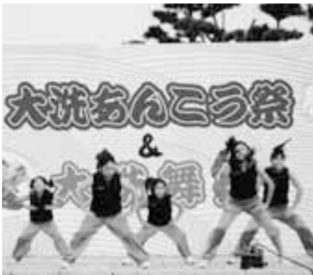
会場を盛り上げた大洗舞祭ダンスコンテスト