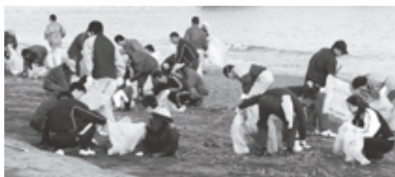
皆さんのご協力によりたくさんのゴミが収集され、綺麗な水辺環境が整いました。

このようなことから、10月28日（土）、地域住民の皆さんや各事業所、町職員等約600人により、大洗海岸と水辺プラザのボランティア清掃を実施しました。