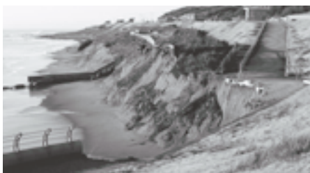
高波の被害を受けたアクアワールド下のプロムナード（10月）

このようなことから、10月28日（土）、地域住民の皆さんや各事業所、町職員等約600人により、大洗海岸と水辺プラザのボランティア清掃を実施しました。