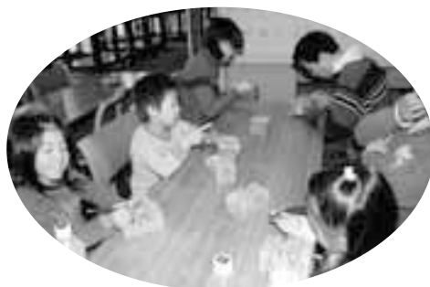
石の断面に文字を刻む篆刻を体験