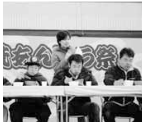
「あんこう飯」の早食いコンテスト しっかり味わって飲み込んで下さい!