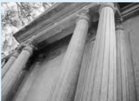
幕末と明治の博物館聖像殿・別館