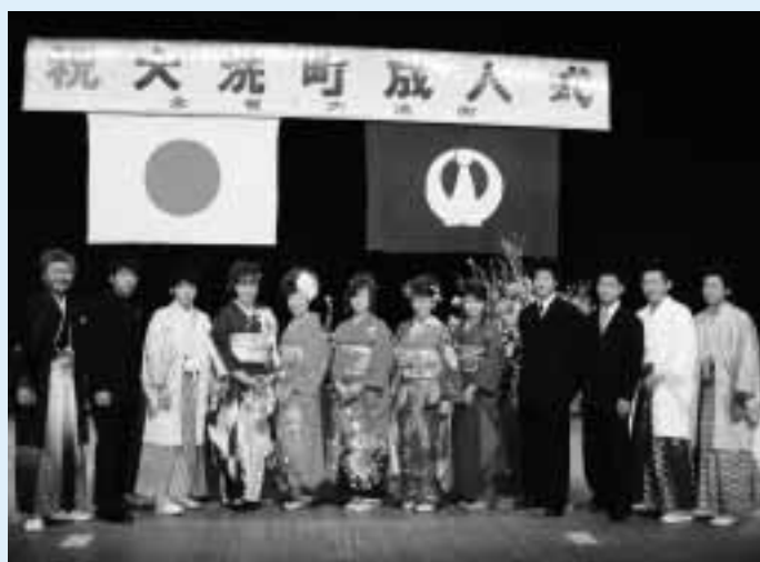
式典を支えた実行委員会の皆さん

中学校恩師からの心あたたまる懐かしいエピソードには思わず笑いが起こり、次代の担い手としての期待が述べられた来賓の祝辞に襟を正す姿も見られました。落ち着いた雰囲気の中、なごやかな式典となりました。