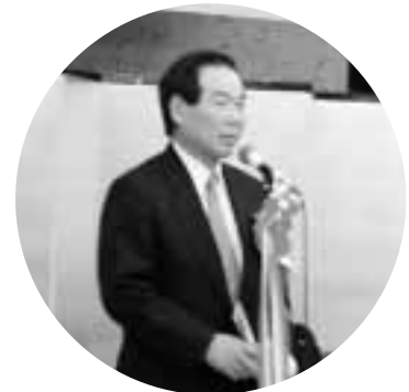
祝辞を述べる額賀衆議院議員

昭和50年から6期24年の永きにわたり大洗町議会議員として地方自治並びに町政の振興発展に尽力され、大洗町議会総務常任委員会委員長をはじめ、各常任委員会委員、大洗町議会原子力問題特別委員会委員等の要職を幅広く歴任され、町経済基盤の振興確立と地方自治発展に多大な貢献をされました。