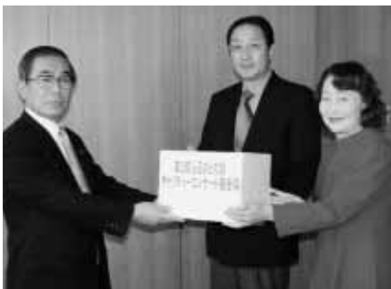
チャリティーの収益金が大洗町社会福祉協議会に寄付されました

大洗にちなんだ歌をお持ちの方々のご協力により、楽しいひとときをすごし、地域のすばらしさを再認識していただく「大洗ふるさとの歌」チャリティーコンサートが12月12日(日)大洗文化センターを会場に開催されました。出演者、スタッフ全員がボランティアで運営にあたったコンサートは、手づくりのあたたかみがあふれていました。