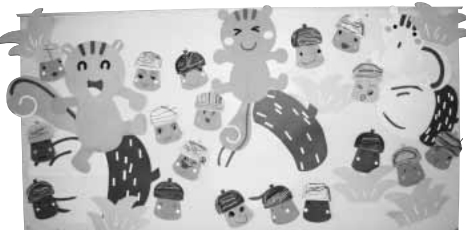
滝口保育園 月組 5歳児18名 「リスちゃんのドングリ転がし」