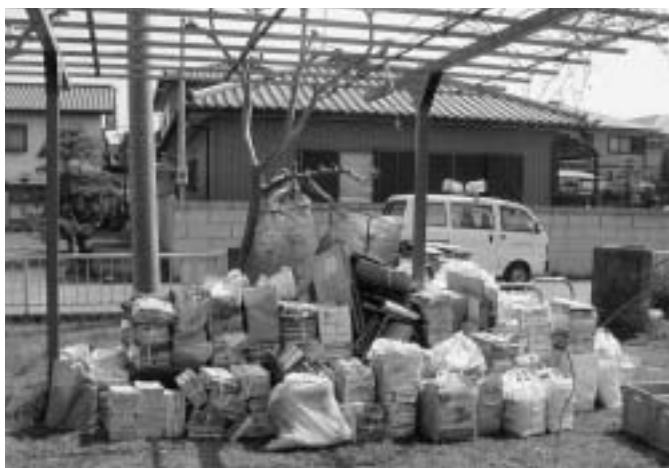
資源ごみは昨年の約3倍になりました

4月に家庭から出されたごみは昨年の4月に比べて可燃ごみが、134トンの減、不燃ごみが87トンの減となり、缶・ビン・ペットボトル・古紙類等の資源ごみは全体で114トン資源化できました。これからも、分別を徹底していただき、ごみの減量化・資源化が図られますようご協力をお願いします。