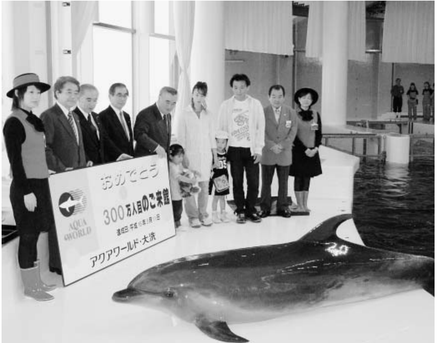
みなさんに親しまれ入館者300万人（アQUALワールド・大洗）記事9P