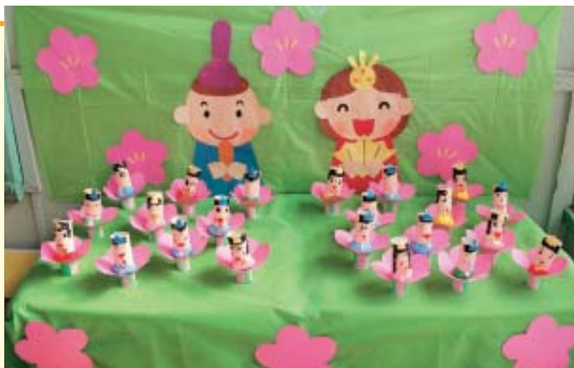
「うれしいひなまつり」