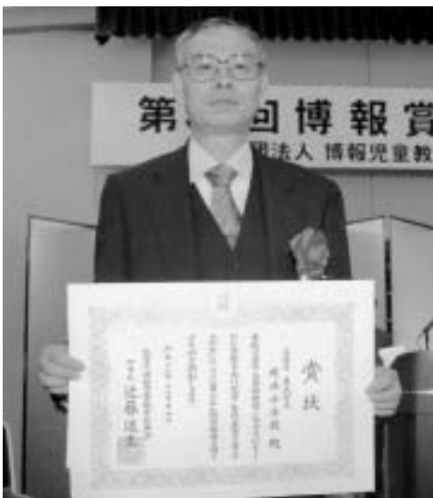
11月14日、東京都如水会館において贈呈式が行われました。（写真は山戸校長）