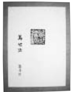
知事賞 「萬世法」小松 好夫