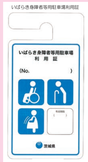
いばらき身障者等用駐車場利用証

問合せ／福祉課 社会福祉係（内線 151・152）又は健康増進課 ☎ 266-1010