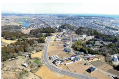
国道51号側より全景