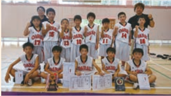
大子町長杯ミニバスケットボール大会

8月24、25日に開催された取手グリーンカップでは、予選を順当に勝ち進み1位リーグに進出。決勝では宿敵、下妻ジャスティスと対戦。3Qまでは9点差と粘っていましたが、4Qで点差を離され36-58で敗れてしまい、準優勝でした。大洗ミニバス男子の更なる活躍に期待しましょう！