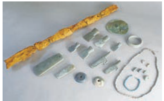
日下ヶ塚(常陸鏡塚)古墳出土副葬品