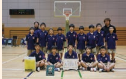
取手グリーンカップ