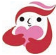
犯罪被害者支援 シンボルマーク ギュッとちゃん