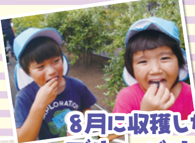
8月に収穫したブルーベリーをジャムにして食べました!