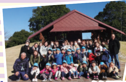
笠間工芸の丘で親子陶芸教室に参加しました!