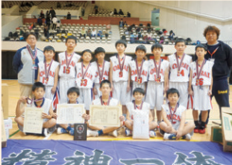
第47回茨城県ミニバスケットボール選手権大会 県大会

11月9、10日、第47回茨城県ミニバスケットボール選手権大会 中央地区予選大会が開催されました。初戦に強敵である市毛ミニバスに勝利した勢いに乗って勝ち進んだ大洗ミニバスは見事、3連覇を果たし県大会に駒を進めました。