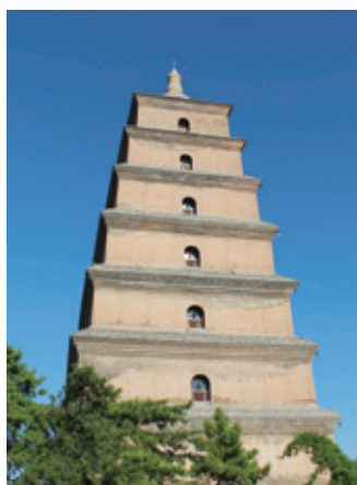
三蔵法師が天竺(インド)から持ち帰った経典を納める大雁塔

詳しくはこちら→ http://www.ibaraki-airport.net/