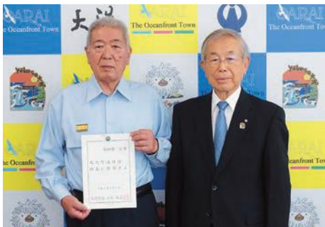
谷田部消防団長と小谷町長

谷田部新団長は、「伝統ある大洗町消防団の団長という大役を拝命し、身の引き締まる思いであります。大洗町の安心・安全のため大洗町消防団の発展に邁進していく所存です」と新団長としての抱負を述べました。