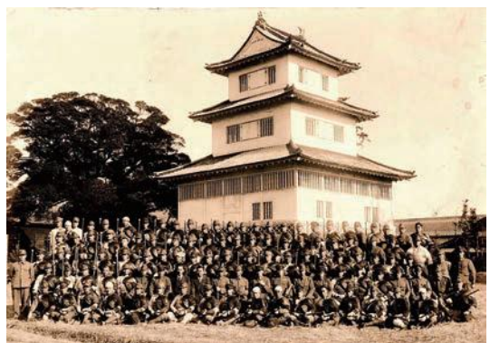
水戸城と歩兵第二連隊