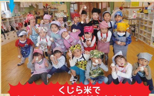
くじら米で おいしいおにぎりが出来ました!!