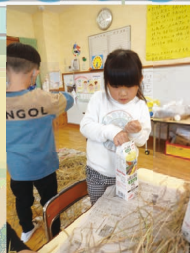
牛乳パック で脱穀しま した!