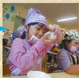
炊きたてご飯 ほっかほか♡