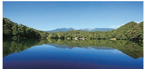
ふるさとの湖 (小海町 松原湖)

大洗町の友好都市小海町では、新型コロナウイルス感染症対策事業として、小海町出身で親元を離れて暮らす学生などを対象に、小海町と大洗町の特産品を無料でお届けする「学生応援！小海エール便」を行っています。大洗町からもブランド認証品をお届けして友好都市の小海町出身のみなさまを応援します！