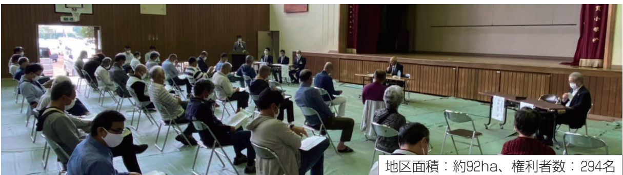
地区面積：約92ha、権利者数：294名