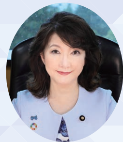
前内閣府特命担当大臣 (地方創生、規制改革、男女共同参画) 参議院議員 片山 かつき