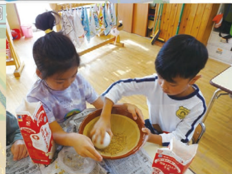
2人で力を 合わせて もみすり!