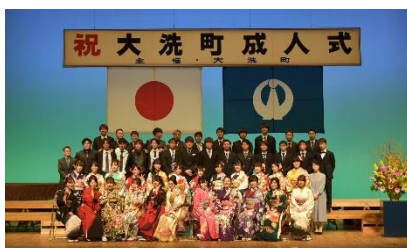
「大洗南中集合写真」