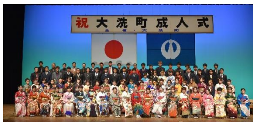
「大洗一中集合写真」

また、開場には新成人の家族をはじめ多くの来賓の方々がお祝いに来場され、新成人の門出を温かく祝福しました。