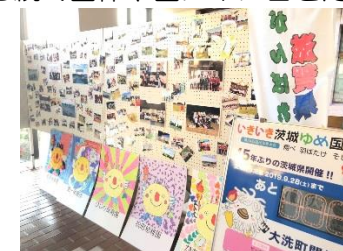
国体写真展示中（ジャランジャラン）