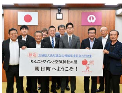
手厚い歓迎の朝日町議会