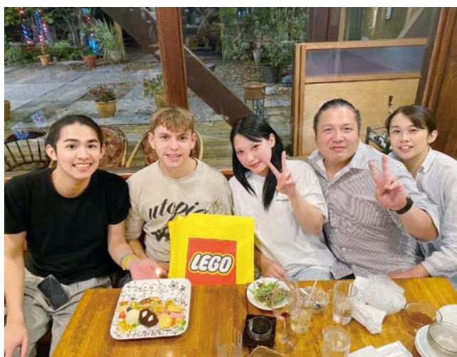
ホストファミリーとのようす

答 海外の方々と交流する体験は、多文化共生を理解していく上でも極めて大切だと思っています。せっかく交流が始まったので、費用対効果も含めて考えながら、前向きに検討していきます。