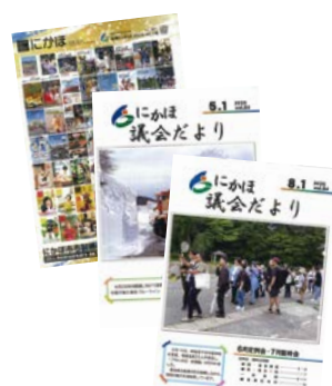
にかほ市議会だより