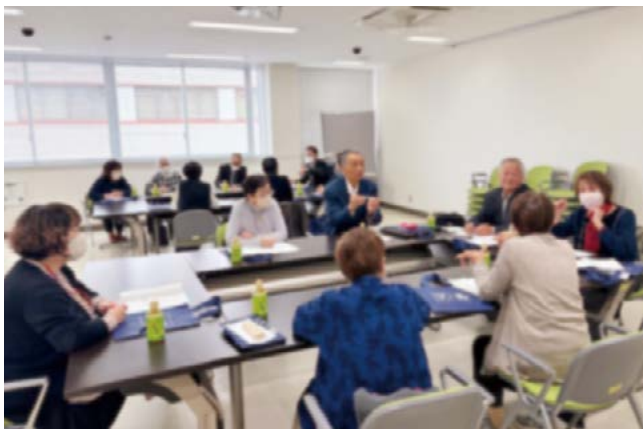
統計調査員研修のようす

答 令和6年度については、他の自治体で統計調査をどのような方法で調査しているか、ひたちなか市役所で統計調査員と情報共有を図る研修を行いました。