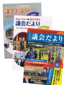
朝日町議会だより