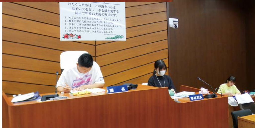
議場内で学習する生徒