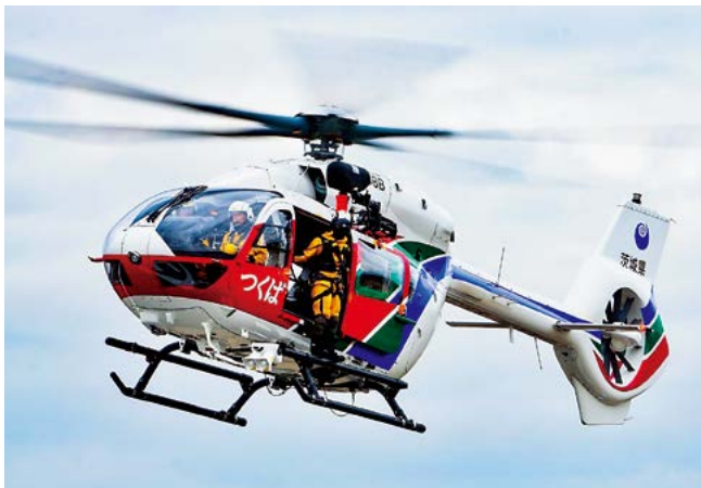
防災訓練のようす

答 44市町村が、人口割で負担金を支出して防災ヘリコプターの運航をするものです。大洗町では、令和5年度から令和7年度まで1名の消防職員が茨城県防災航空隊に派遣されています。