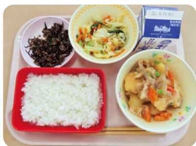
給食献立例 ひじきのふりかけごはん 牛乳 肉じゃが たくあん和え (米とふりかけに使用した ちりめんじゃこが大洗産)

今後、食材費等の高騰が学校給食の現場にどれだけ影響を与えていくのか、価格の動向を注視し、使用量や栄養価を落とさずに、万が一の時の財源の確保等も含め、適切に対応していきます。