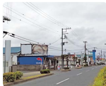
既にある海沿いの商業施設

また、場所の候補地選定については、現在、漁港区周辺が盛況になってきているため再考の必要性を感じる。人口減少社会の中での事業計画にあたっては、改めて、より慎重に取り組んでいただきたい。